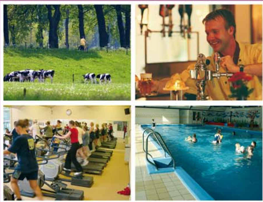
Faciliteiten op Gerner:

Restaurant Auberge 't Asje: sfeervol uit eten in oude boerderij naast de receptie - gourmet- en ontbijt-op-bed service - fiets- en skelterverhuur - speeltuintje met zandbak